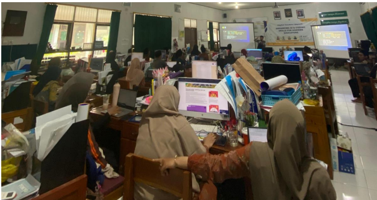
Gambar 2. Praktek penggunaan AI untuk pengembangan materi pembelajaran

Setelah itu, dilanjutkan dengan demonstrasi koding sederhana menggunakan python untuk membuat sistem perhitungan kasir sederhana yang dilanjutkan dengan pembuatan dataset dan pembangunan model prediksi kelulusan siswa sederhana dengan model Logistic Regression.