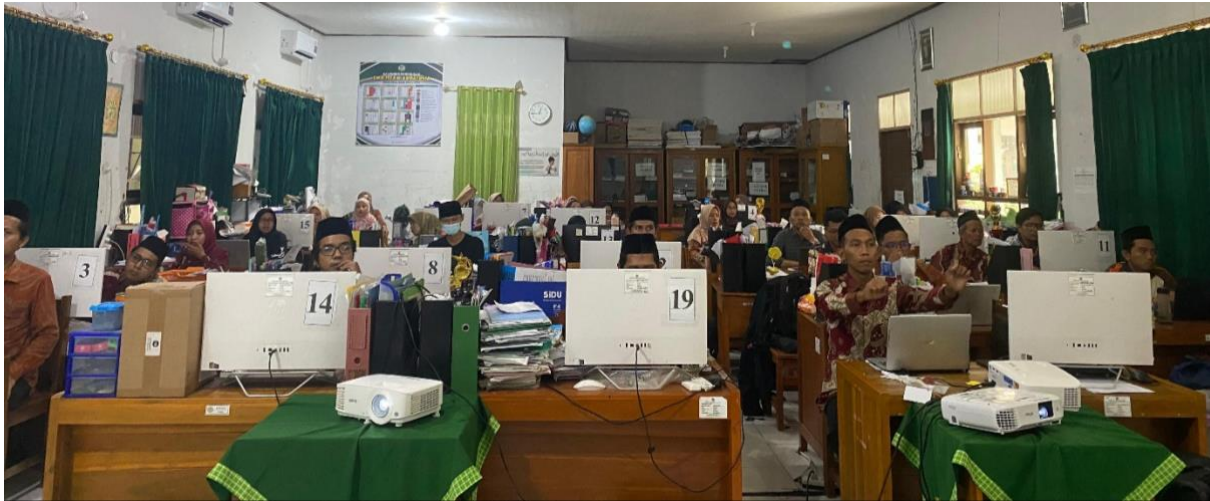
Gambar 1. Tenaga Pendidik Memperhatikan Penjelasan Materi Penggunaan AI untuk Edukasi

Sesi 1 disampaikan tentang penerapan AI dalam dunia Pendidikan terutama bagi guru sebagai alat bantu untuk pembuatan materi pembelajaran yang dilanjutkan dengan praktek prompting dengan menggunakan platform seperti ChatGPT dan Gemini.