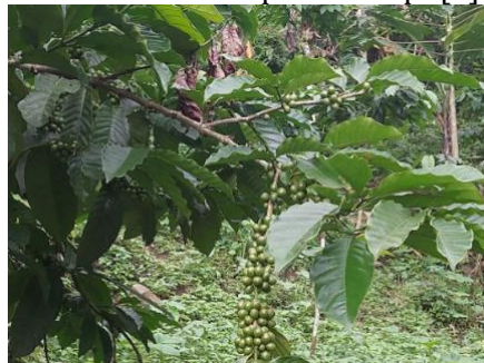
Gambar 1. Potensi Agroforestry Kopi Desa Peron

Berdasarkan data dari [5] Sektor agroforestry khususnya kopi sebagai produk lokal khas Desa Peron memiliki potensi besar, baik dari sisi nilai tambah maupun pemanfaatan seluruh bagian tumbuhan kopi. Menurut [6], selain kopi biji (bubuk dan sangrai), terdapat produk samping seperti kulit buah kopi yang dapat diolah menjadi teh cascara, atau produk lain yang bernilai ekonomis dan ramah lingkungan seperti pupuk organik cair. Pemanfaatan limbah kopi menjadi cascara atau POC telah dilakukan di beberapa daerah dan menunjukkan hasil positif dalam pemberdayaan masyarakat serta diversifikasi produk kopi [7].