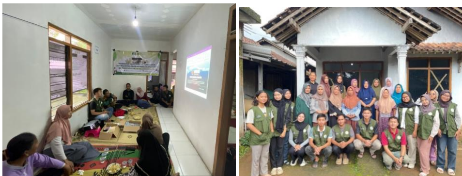
Gambar 3. Penyampaian Materi dari Narasumber (Kiri); Foto bersama Kelompok Sekar (Kanan)

Mitra menyampaikan bahwa sebelumnya mereka belum memahami secara rinci mengenai tahapan pendaftaran SPP-IRT, mulai dari dokumen yang dibutuhkan hingga uji laboratorium produk. Melalui sosialisasi ini, pemahaman mitra meningkat, ditunjukkan dari kemampuan mereka menjelaskan kembali alur pendaftaran dan manfaat legalitas usaha. Kegiatan ini juga menumbuhkan motivasi mitra untuk segera mengurus SPP-IRT sebagai langkah strategis dalam pengembangan usaha.