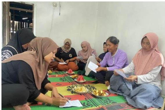
Gambar 4. Proses Pendampingan Teknis Adminstrasi

Tahap berikutnya adalah pendampingan teknis terkait administrasi pendaftaran SPP-IRT. Mitra didampingi secara langsung dalam mengisi formulir pengajuan, melengkapi dokumen (KTP, NPWP, dan Nomor Induk Berusaha), serta penyusunan label produk sesuai ketentuan Badan POM. Pendampingan dilakukan secara intensif agar mitra benar-benar memahami detail teknis yang sering kali menjadi hambatan dalam pengajuan legalitas usaha.