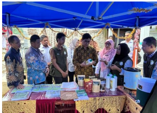
Gambar 5. Visitasi ke Rumah Produksi Kopi oleh Dirjen Belmawa Kemdiktisaintek

Dampak langsung dari sertifikasi ini adalah meningkatnya kepercayaan konsumen terhadap keamanan dan mutu produk. Selain itu, mitra dapat memperluas distribusi produk ke pasar modern, toko oleh-oleh, serta memanfaatkan platform digital dengan lebih percaya diri. Keberhasilan memperoleh SPP-IRT juga meningkatkan motivasi mitra untuk menjaga konsistensi kualitas produk dan menerapkan praktik produksi yang sesuai standar. Guna meninjau keberhasilan tim dalam mendampingi kelompok Sekar, Dirjen Belmawa Kemdiktisaintek melakukan visitasi ke rumah produksi kopi di Desa Peron seperti pada Gambar 5 berikut.